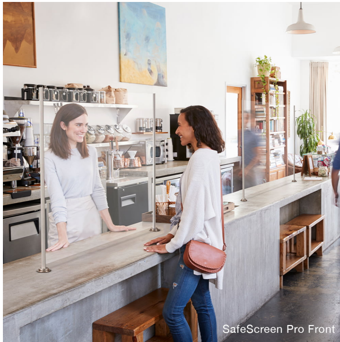
SafeScreen Pro Front